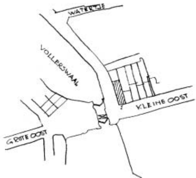
Situatie ca. 1880