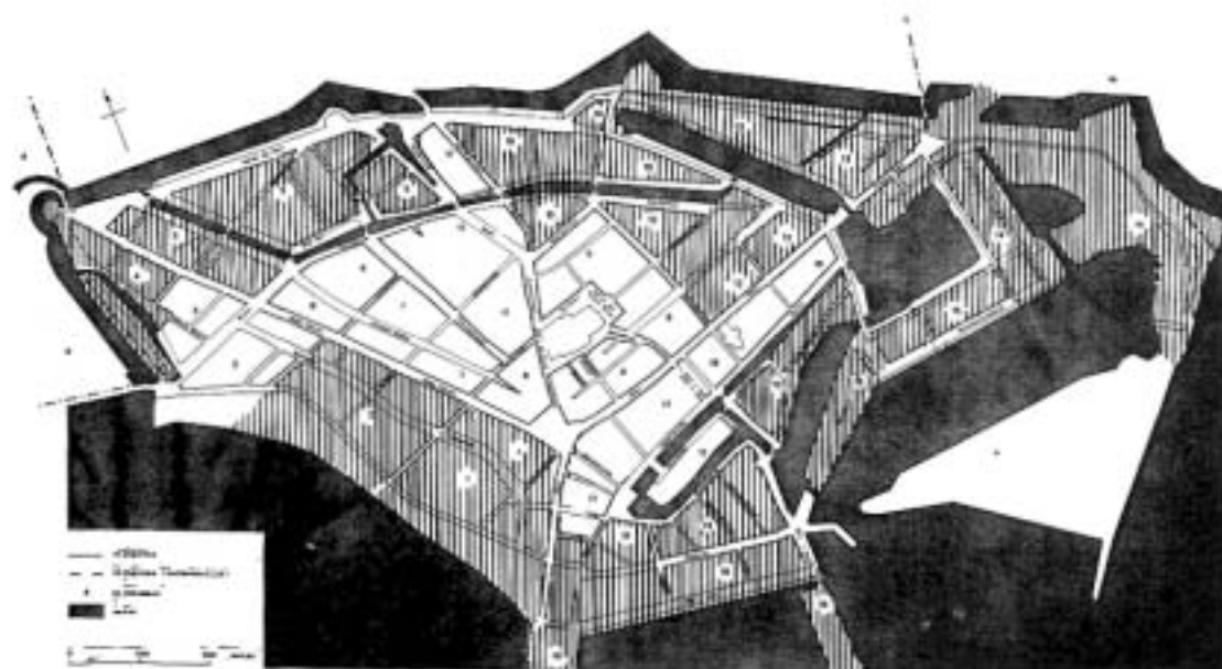
Kaart 2. Hoorn 1806: Gearceerd de wijken met een meer dan gemiddeld percentage arbeiders (groep 2).